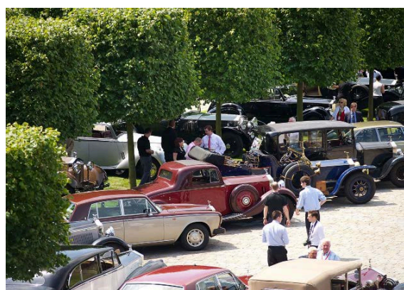
Un parking d'exception, ce jour-là !