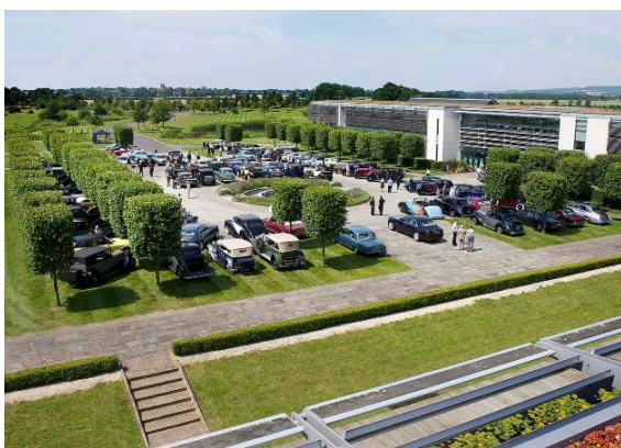
L'usine ultra moderne de Goodwood

Mais l'événement s'était ouvert pour les 100 premières voitures inscrites avec une somptueuse réception à l'usine Rolls-Royce de Goodwood. Le sujet était : 100 Rolls-Royce pour 100 ans (de Spirit of Ecstasy).