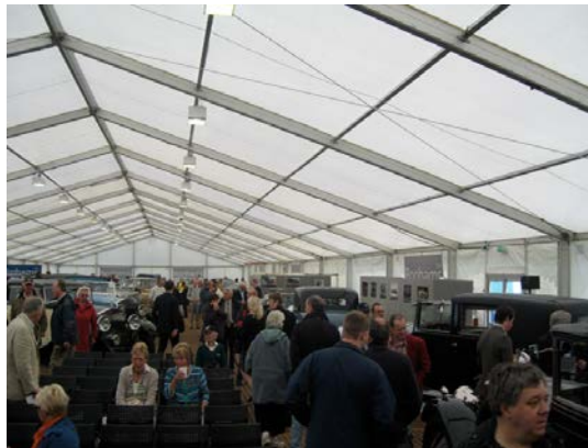
Avant la vente : curieux et acheteurs s'affairent

Au cours de la journée du vendredi et samedi, on peut également assister à toute une série de séminaires donnés par des spécialistes. Ce sont des séminaires techniques mais aussi de questions d'intérêt général autour des marques Rolls-Royce et Bentley.