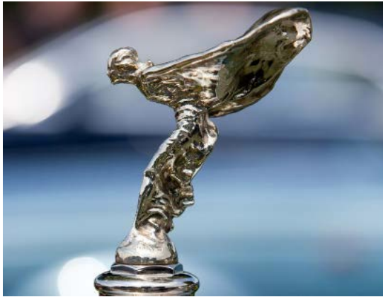
Spirit of Ecstasy : dans sa version la plus connue ...

réputation de la marque. Fût donc décidé de livrer les voitures avec une mascotte d'usine et l'on demanda à un artiste, Charles Sykes, de créer une sculpture ce qui donna lieu à la fameuse Silver Lady, Emily, Spirit of Ecstasy, pour ne nommer que quelques désignations. Et donc dès 1911 cette mascotte devint officielle, équipant toutes les voitures dès l'usine.