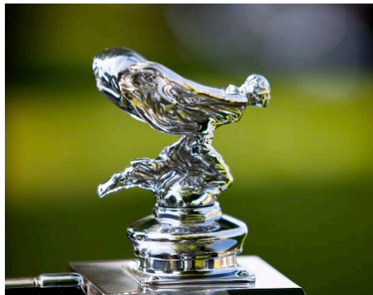
... ou dans sa pose agenouillée « kneeling »

Autour d'elle il y a une fabuleuse histoire, voire mythe. Le modèle pris par Charles Sykes aurait été Eleanor Thornton, la secrétaire de Lord Montague of Beaulieu (se prononce biouli). Pour faire l'histoire plus intéressante, lors d'un voyage en bateau du Lord avec sa ... secrétaire vers l'Inde, le bateau fût atteint par une torpille et coula. Eleanor se noyât et le Lord se sauva après un long périple dans un canot de sauvetage.