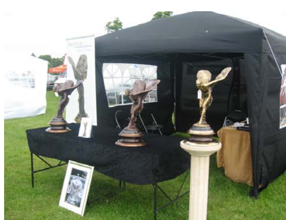
Un mélange d'humour et d'élégance à l'anglaise ...

Samedi soir c'est le « Dinner and Dance » du club. Cela n'a d'intérêt pour nous étrangers que si nous sommes nombreux et pouvons nous mettre autour d'une même table comme cela a été le cas en une occasion. Si non, c'est un peu difficile avec des amis anglais, sauf si on les connaît bien. Aussi les plats ne sont pas trop impressionnants puisque faire diner quelques centaines de personnes dans un hôtel ne donne que rarement de bons résultats.