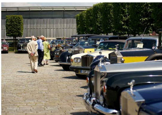
Où est passée ma voiture ?

Disposer les 100 Rolls-Royce dans cette cour a pris un certain temps permettant à ceux déjà arrivés de prendre une première coupe de champagne et visiter une exposition de photos autour du sujet de notre mascotte, qui était évidemment au centre de l'événement.