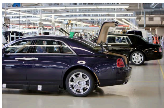
... on s'attend presque à entendre une petite musique douce

Disposer les 100 Rolls-Royce dans cette cour a pris un certain temps permettant à ceux déjà arrivés de prendre une première coupe de champagne et visiter une exposition de photos autour du sujet de notre mascotte, qui était évidemment au centre de l'événement.