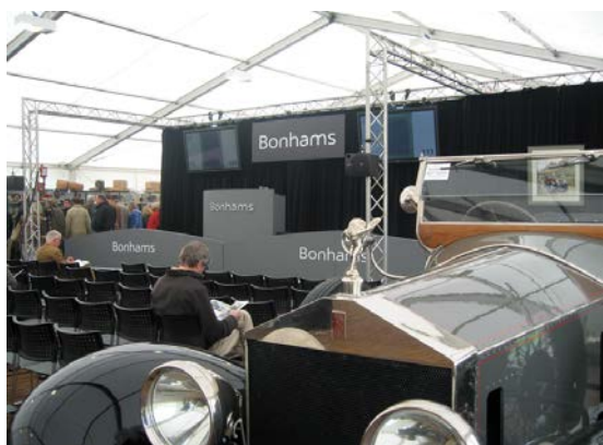
La salle des ventes de Bonhams prête pour les premières enchères

Un autre point fort est la vente aux enchères organisée tous les ans par Bonhams. Elle a lieu le samedi. Le matin, ce sont les « automobilia » qui sont vendus aux enchères (pièces d'échange, bouquins, prospectus, mallettes de pique-nique, tableaux, mascottes, etc.). Et l'après-midi, c'est la vente des voitures. Le tout commence par un cocktail offert par Bonhams le vendredi soir où l'on peut voir tous les objets et voiture de la vente, rencontrer ses amis ou en connaître de nouveaux.