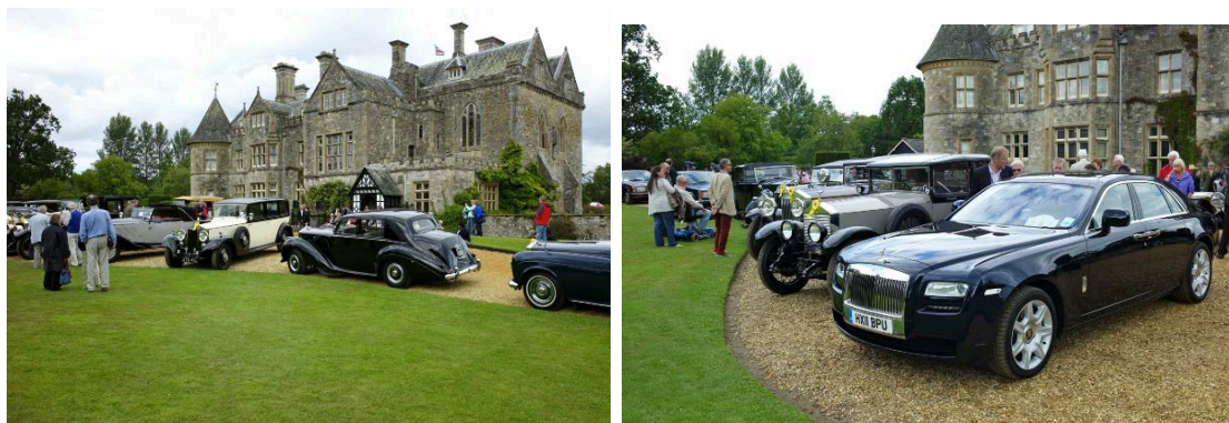
Les autos à Palace House, la résidence de Lord Montague

S'ensuivit un défilé des voitures sélectionnées finalisant devant le Palace House, résidence de l'actuel Lord Montague of Beaulieu.