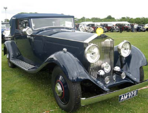
Cocarde Jaune : Deuxième Prix pour cette R-R Phantom II