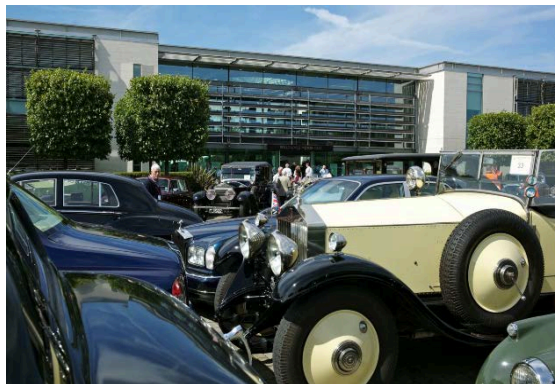
Trafic jam ... Chocking !

Suivaient deux séminaires autour des possibilités d'individualisation des nouvelles Rolls-Royce Phantom et Ghost ainsi que sur le procédé de fabrication du Spirit of Ecstasy. Un autre grand moment : la visite de l'usine entre le déjeuner pique-nique et le thé anglais offerts par Rolls-Royce Motors.